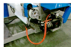
Alineadora Neumática - Hidráulica