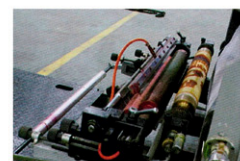
Circulación de tinta con bomba